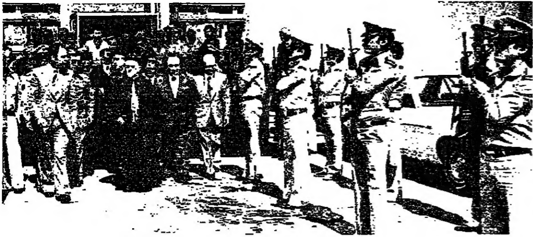
ثلاثة من الدرك تسوي التحية للبطريرك في المطار